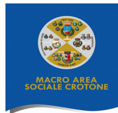
MACRO AREA SOCIALE CROTONE

L'EVENTO 2007 - 386625, CON OBIETTIVO FORMATIVO N° 3 È STATO ACCREDITATO ECM PER N. 80 PARTECIPANTI CON SEGUENTI PROFESSIONI E DISCIPLINE: MEDICO CHIRURGO (NEUROPSICHIATRIA INFANTILE, PSICHIATRIA); PSICOLOGO (PSICOLOGIA, PSICOTERAPIA); LOGOPEDISTA; TECNICO DELLA RIABILITAZIONE PSICHIATRICA; TERAPISTA DELLA NEURO E PSICOMOTRICITÀ DELL'ETÀ EVOLUTIVA; TERAPISTA OCCUPAZIONALE. IL PROVIDER QIBLI SRL (ID N. 2007) HA ASSEGNATO A QUESTO EVENTO N° 21 CREDITI FORMATIVI. PER L'EVENTO SARANNO RICHIESTI, AL CNOAS, I CREDITI FORMATIVI PER GLI ASSISTENTI SOCIALI.